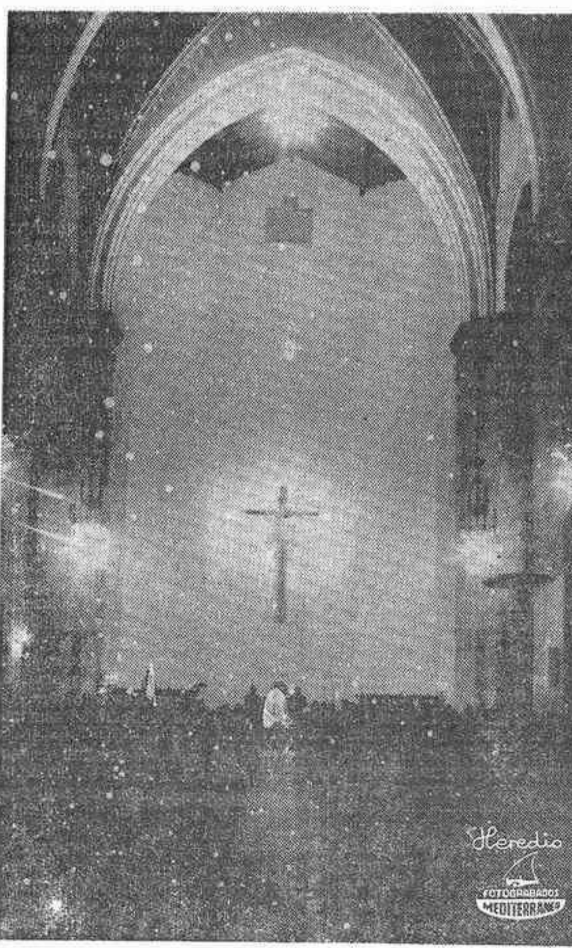
NOTAS DE ARTE

No obstante todo ello, la Nochevieja siguió teniendo un fondo religioso para muchos, y también los templos registraron gran afluencia de fieles en la vigilia de esas horas tan significativas para los hombres.