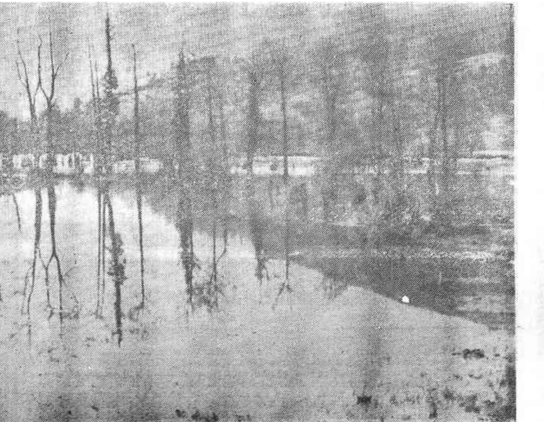
SANTANDER, 20. — Campos inundados a causa del desbordamiento del río Pas en las cercanías de Saron, como consecuencia del temporal de lluvias que azota esta provincia.