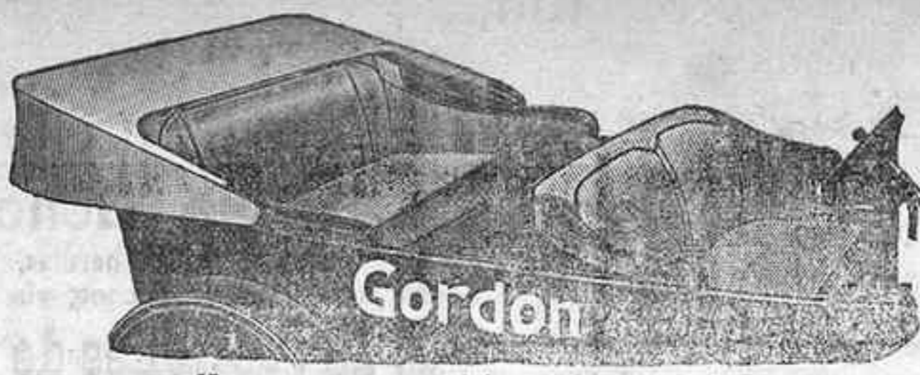
Haga que su auto viejo parezca nuevo! Mantenga siempre reluciente su auto nuevo!

Se acomodan fácilmente en todos los modelos de automóviles populares. Cubren los cojines, respaldos, las Portezuelas y las Piezas del frente. Capota y la Pieza para el lado posterior del Asiento del Frente, son extras. Se ajustan con Bolones de Presión.