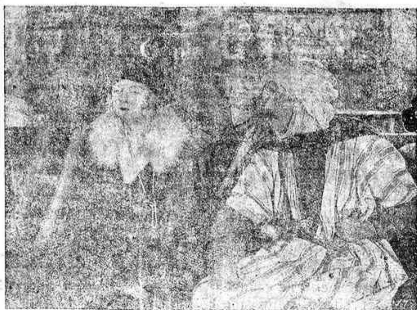
Una interesante escena de la extraordinaria película EL JARDIN DE ALA, cuyo estreno se anuncia para mañana en el Teatro Guimerá.

El agresor fué detenido, negando su delito; pero como el herido lo señalara como autor de las puñaladas, por orden del Juzgado de Instrucción, que intervino en el hecho, fué encarcelado e incomunicado. Prestó servicio en el Tercio de Extranjeros.