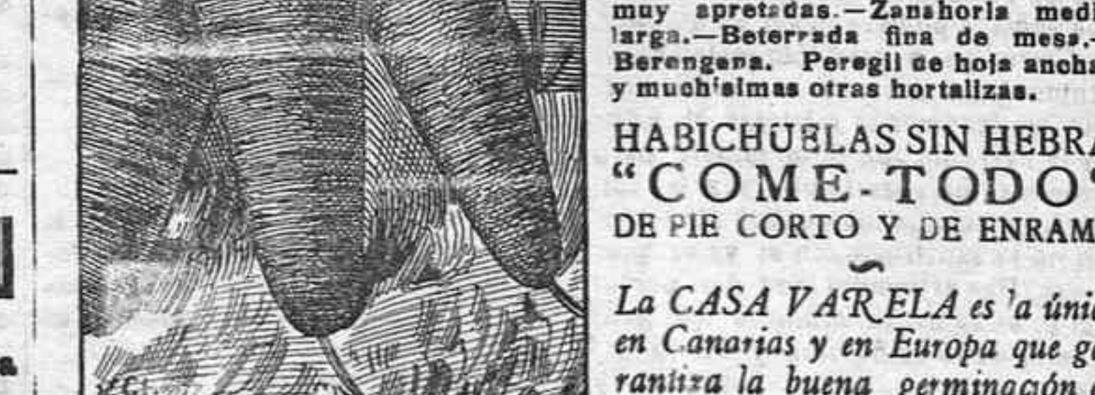
Zanahoria Medio Larga

Méndez Núñez, No. 16.—Santa Cruz de Tenerife