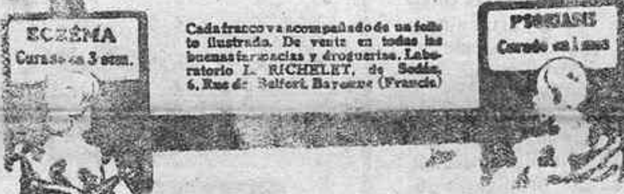
ESQUEMA Curado en 3 días.

es de todos los remedios conocidos el que obra mejor en este sentido. Sean los que fueren su origen, su gravedad y su cronidad, ninguna enfermedad de la piel, ninguna varicela ni úlcera varicosa, ningún vicio de la sangre puede resistir a este poderoso modificador del líquido sanguíneo. Su acción benéfica se manifiesta aún con más rapidez en el tratamiento de los reumatismos, dolores, gota, enfisema, congestiones, arterio-esclerosis, y neuralgias, tan comunes en estos momentos.