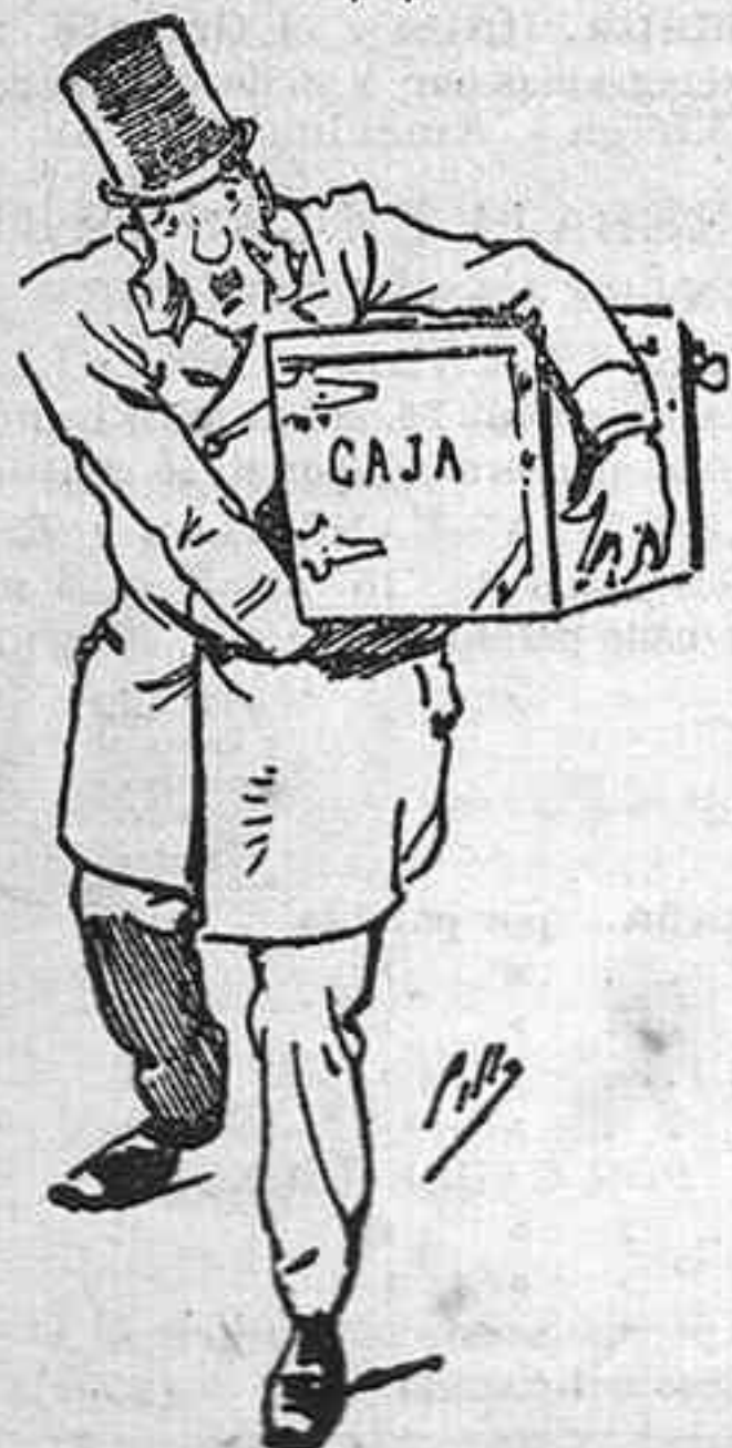
Cajeros he visto cien

¡Qué bien la modista en blanco dijo á la del sotabanco! uno fuma, Guadalupe, y otro escupe.