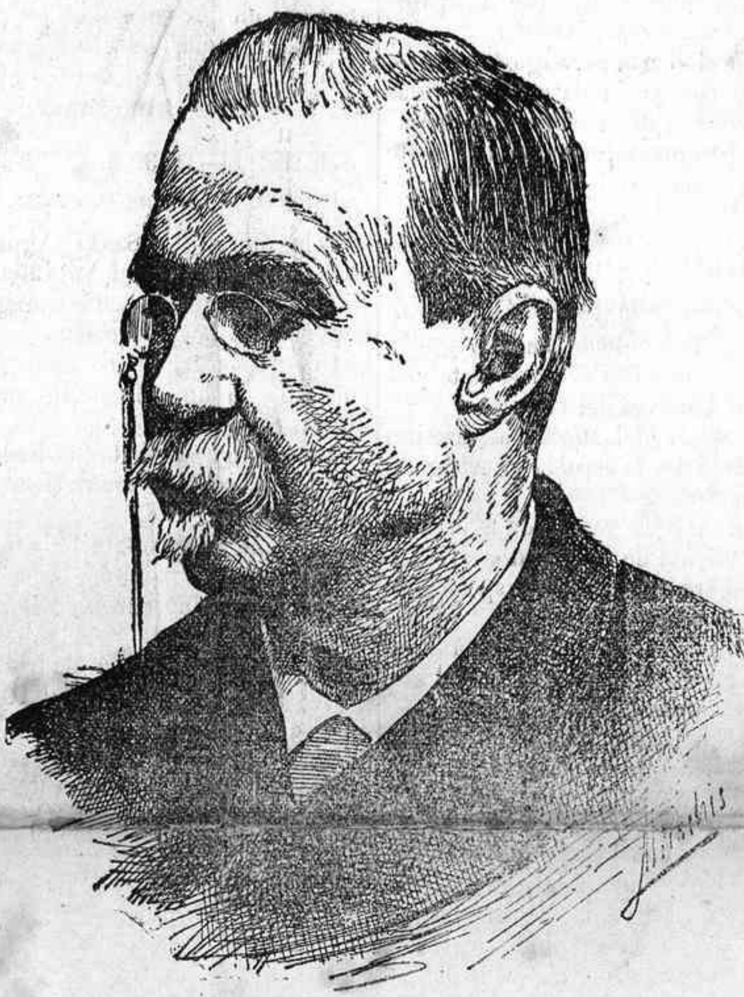
A Cánovas del Castillo

URGENTE. Tan pronto como fué conocido el atentado contra el Sr. Cánovas del