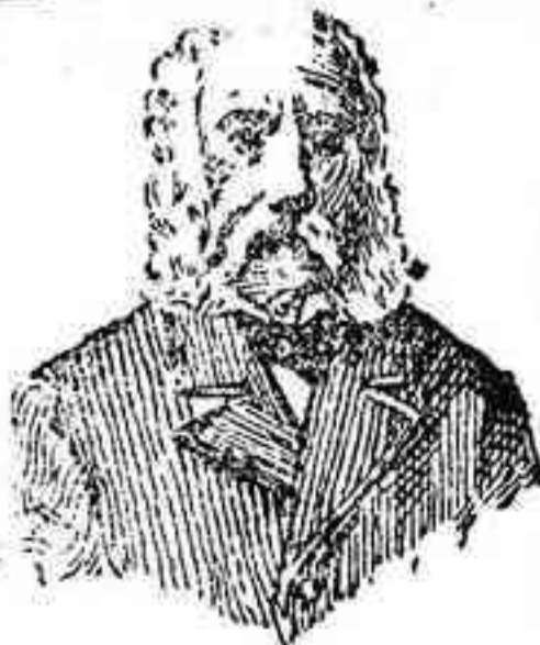
A. Charles Lambert PARIS Depósito General Calle Balmes, 106 Barcelona.