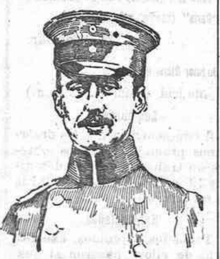
Príncipe Oscar de Prusia