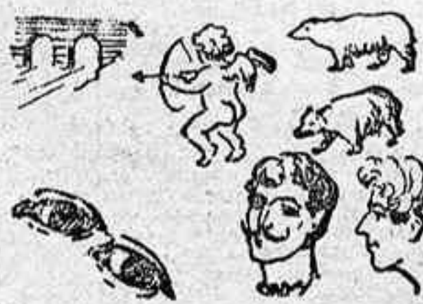
La solución, máquina.