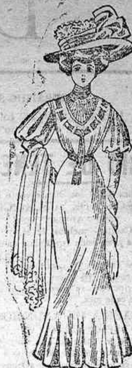
Traje para «sport».—De percalina gris perla. Cuerpo y falda de una pieza. El primero forma blusa, con descote y cuello de seda rayada, y adornos de pasamanería alrededor del cuello y descote, con caída en el delantero. Manga ancha y corta con respunte en el puño. Cinturón de seda. Falda señida con pliegues en el bajo.

que el cuerpo, colocado aquél como se ve en el modelo.