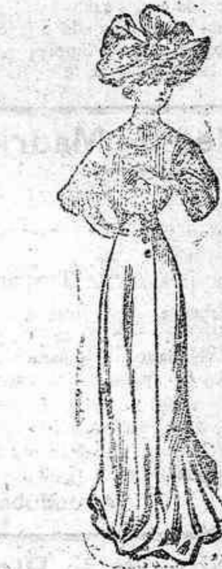
Traje para calle.—Bolero de batista rayada, con bordado y manga corta. Falda alta de talle; en éste tres botones y en el bajo algunos pliegues formando volante.