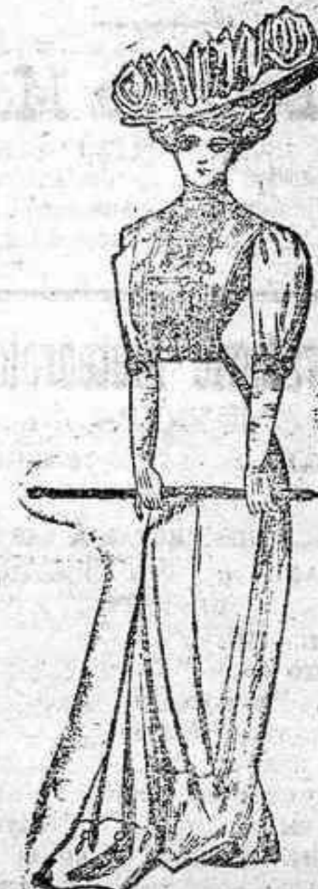
Traje para paseo.—Cuerpo blusa de piqué, color claro, tableada en el delantero y con bordado figurando descote. Manga corta con puño bordado. Falda de dril tierra, con vuelo en el bajo y un bordadito en el mismo.