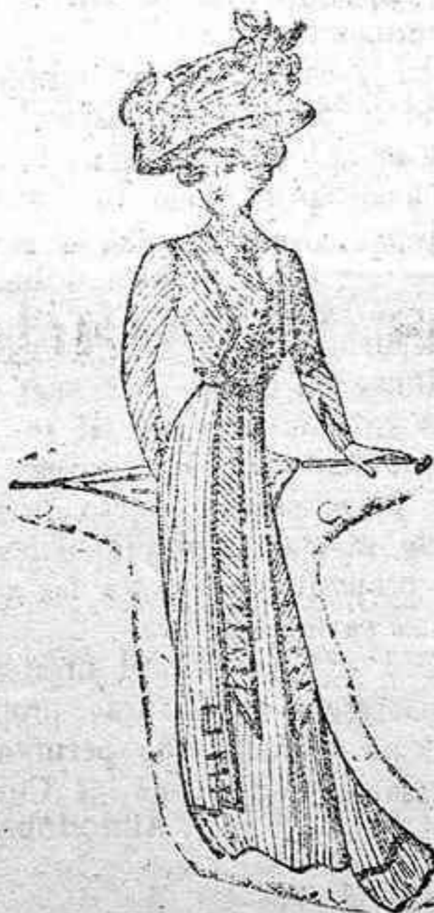
Traje para primavera.—De dril rayado. Bolero guarnecido con pasamanería y botones fantasía. Manga estrecha. Falda con idéntico adorno

de gobierno, reanudando con la mayor finura el hilo del relato.