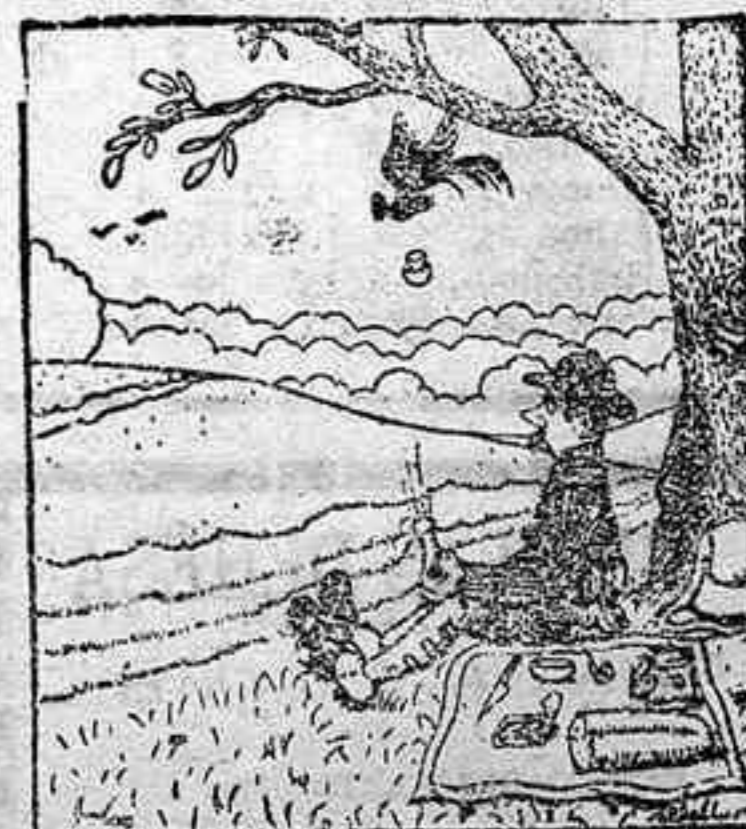
Nuevo método de caza al alcance de los cazadores distinguidos.