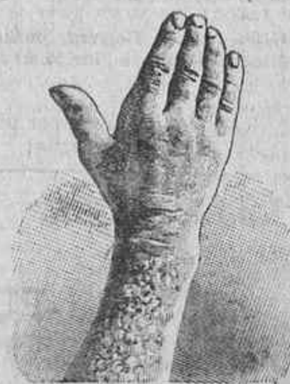
Antes de la curación.