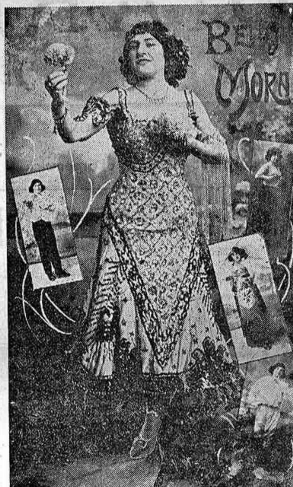
Canzonetista que esta noche se presenta en dicho teatro

«Miré detonadamente el instrumento, que me pareció un violín de juguete muy averiado, y dije resueltamente: