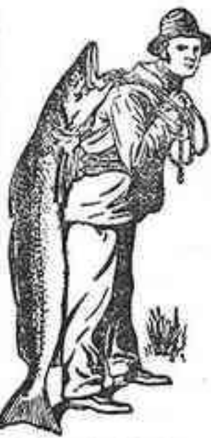
Marca de fábrica.

El aceite de hígado de bacalao usado en la Emulsión Scott es tan puro y resulta tan agradable al paladar que la más tierna criatura puede tomarlo sin dificultad y sin peligro de perjudicar las funciones digestivas. Ninguna otra Emulsión contiene aceite de hígado de bacalao de esta calidad ni tiene sus propiedades curativas.