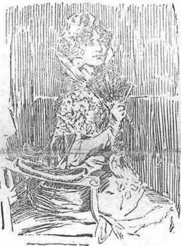
Apunte del cuadro de I. Zuloaga, «La del Abanico».

La Exposición Internacional de Bellas Artes de Barcelona