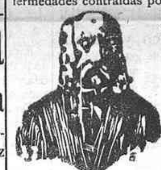
A. Charles Lambert—París. Depósito general Calle Balmes número 106 BARCELONA

El eminente doctor Charles Lambert, de París, después de un profundo estudio sobre las enfermedades venéreas y sifilíticas ha encontrado el medio de curarlas radicalmente, no solo sin hacer uso del MERCURIO, sino que combate las enfermedades contraídas por el uso de dicha sustancia. El tratamiento es sencillísimo y las fórmulas son puramente vegetales, pues en su composición solo entran hierbas minerales de la India. Estas fórmulas las presenta en las formas siguientes: Las Píldoras Charles Lambert, que curan las purgaciones, estrecheces de la uretra, flujo blanco de la muger, y gota militar. La Inyección Charles Lambert, que debe de usarse al mismo tiempo que las píldoras para que la curación sea más radical y pronta. El Elixir Charles Lambert es un gran medicamento, eficazísimo para la completa destrucción de todo bacilo sifilítico. Con su uso se purifica la sangre impura, dejándola en su estado normal, libre de todo virus, dando salud é inmunidad para evitar la reproducción de tan terrible enfermedad. Este Elixir debe de tomarse como complemento del tratamiento, una vez que los efectos, ó sea la purgación haya desaparecido. Precio de las Píldoras, pesetas 4'50, La Inyección, pesetas 3'80 y el Elixir 3'80.—De venta en Santa Cruz de Tenerife (Canarias), en la farmacia de Serra, calle del Castillo número 7. Para cualquier duda que se presente consúltese por escrito al inventor, calle Balmes, 106, Barcelona.