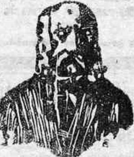
A. Charles Lambert—París. Depósito general Calle Balmes número 106, Barcelona. BARCELONA

Descubrimiento importantísimo. El eminente doctor Charles Lambert, de París, después de un profundo estudio sobre las enfermedades venéreas y sífilíticas ha encontrado el medio de curarlas radicalmente, no solo sin hacer uso del MERCURIO, sino que combate las enfermedades contraídas por el uso de dicha sustancia. El tratamiento es sencillísimo y las fórmulas son puramente vegetales, pues en su composición solo entran hierbas minerales de la India. Estas fórmulas las presenta en las formas siguientes: Las Píldoras Charles Lambert, que curan las purgaciones, estrecheces de la uretra, flujo blanco de la muger, y gota militar. La Inyección Charles Lambert, que debe de usarse al mismo tiempo que las píldoras para que la curación sea más radical y pronta. El Elixir Charles Lambert es un gran medicamento, eficazísimo para la completa destrucción de todo bacilo sífilítico. Con su uso se purifica la sangre impura, dejándola en su estado normal, libre de todo virus, dando salud é inmunidad para evitar la reproducción de tan terrible enfermedad. Este Elixir debe de tomarse como complemento del tratamiento, una vez que los efectos, ó sea la purgación haya desaparecido. Precio de las Píldoras, pesetas 4'50, La Inyección, pesetas 3'80 y el Elixir 3'80.—De venta en Santa Cruz de Tenerife (Canarias), en la farmacia de Serra, calle del Castillo número 7. Para cualquier duda que se presente consúltese por escrito al inventor, calle Balmes, 106, Barcelona.