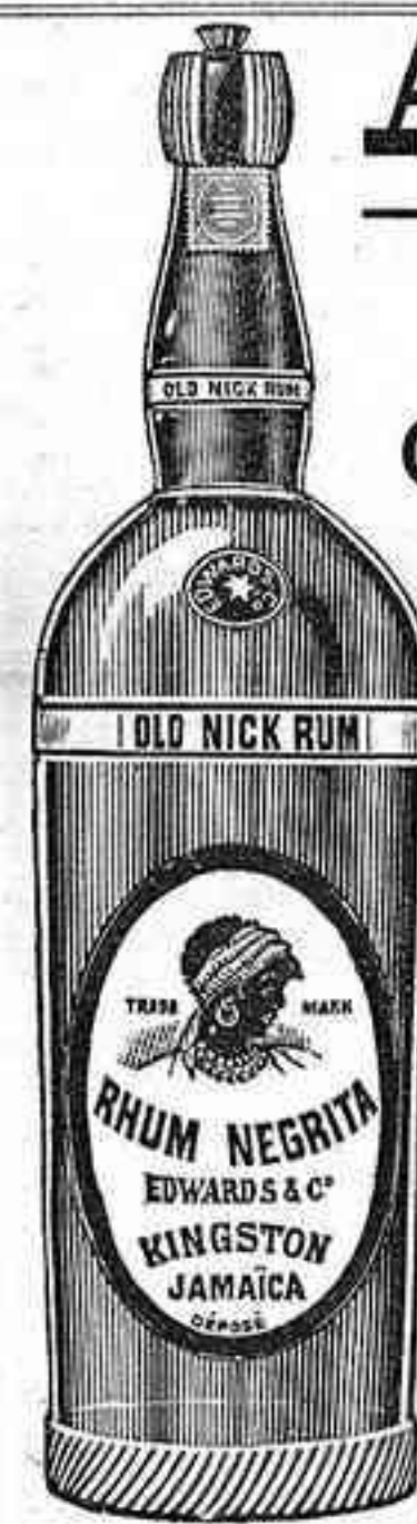
Verdadero "Ron Negrita" Fijarse bien en la etiqueta

de Kingston, (Jamaica), en la etiqueta de la botella, como en la misma verá el lector.