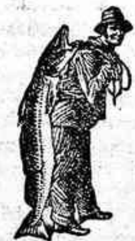
Obténase siempre la Emulsión con esta marca «El Pescador» marca del procedimiento Scott!

Si desea V. los resultados que está probado da constantemente la Emulsión de SCOTT, ha de tener la seguridad de comprar la de SCOTT, con «el pescador» y el «pescado» en la envoltura y ninguna otra; de lo contrario sufrirá V. un desengaño serio. Todas las droguerías y farmacias venden la de SCOTT.