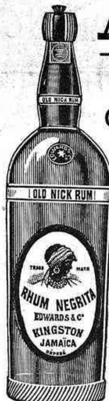
Verdadero "Ron Negrita" Fijarse bien en la etiqueta