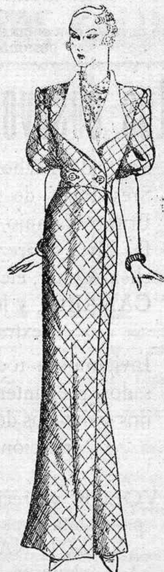
ROPA DE CASA

Está ejecutado en satín verde hierba adornado de picados de gruesa seda formando cuadros. Amplio cuello doble hecho por un bies de tono semejante. Bolsillo al costado.