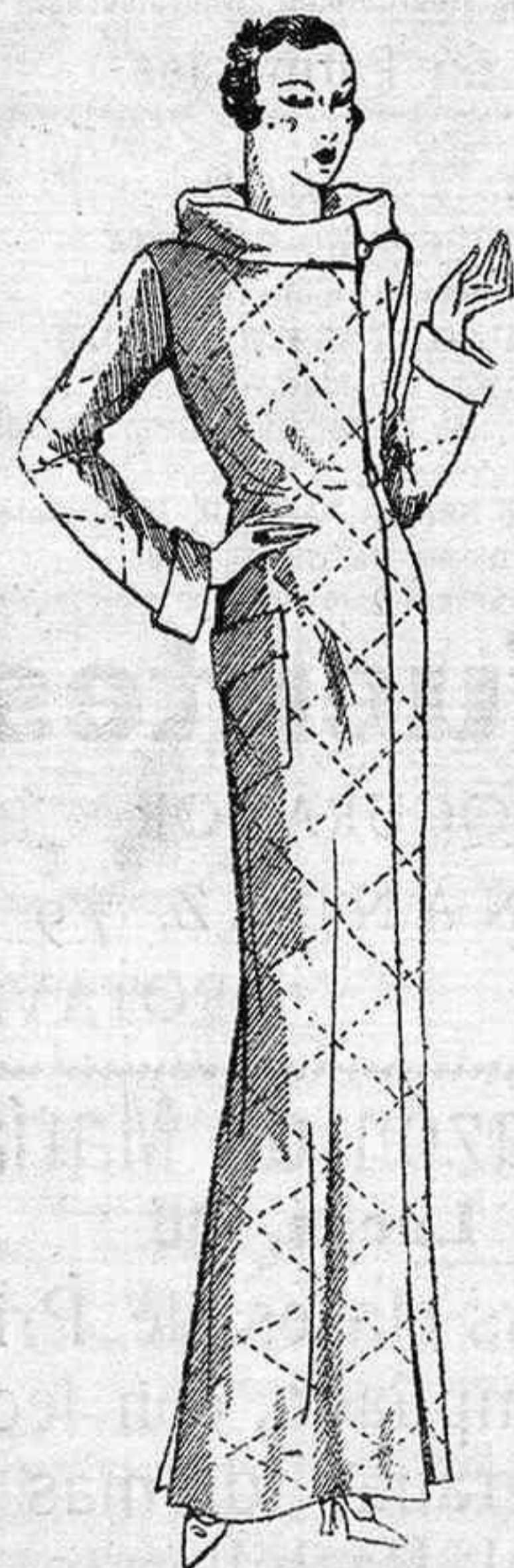
SALTO DE CAMA

Está ejecutado en satín verde hierba adornado de picados de gruesa seda formando cuadros. Amplio cuello doble hecho por un bies de tono semejante. Bolsillo al costado.