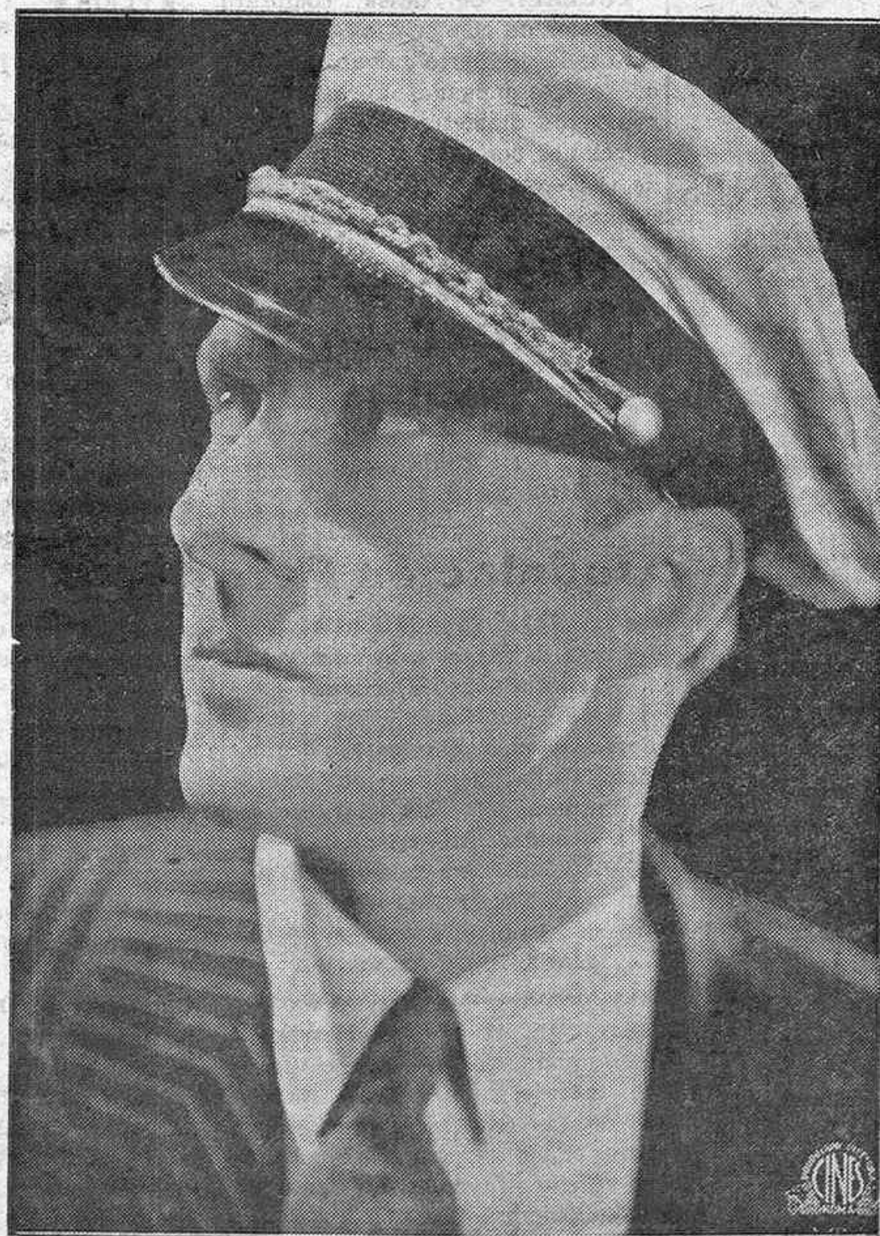
UNO DE LOS MAS POPULARES ARTISTAS DE HOLLYWOOD

¿Hollywood acabado? ¡No es fácil! ¡Hollywood sólo empieza!"