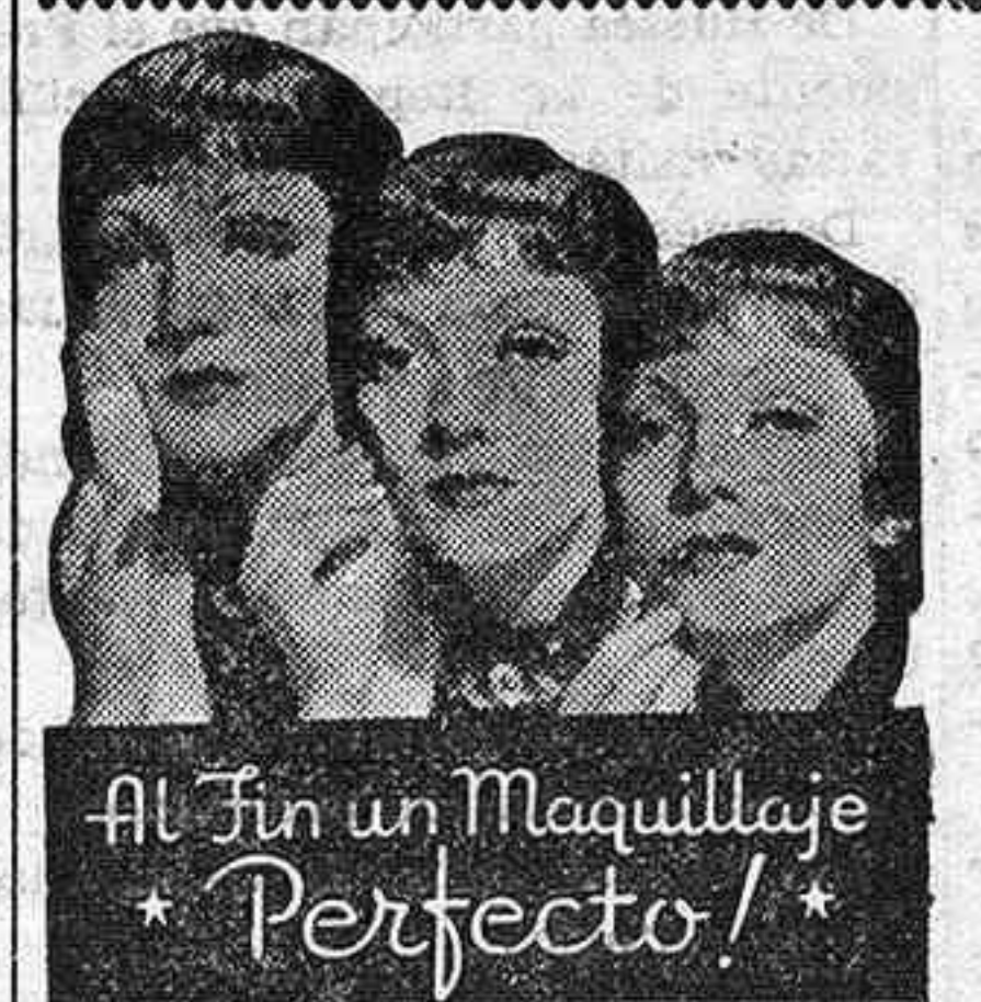
DEMONSTRACION POR CLAUDETTE COLBERT

Hacemos llegar a su viuda, hijos y demás familiares nuestra sentida condolencia.