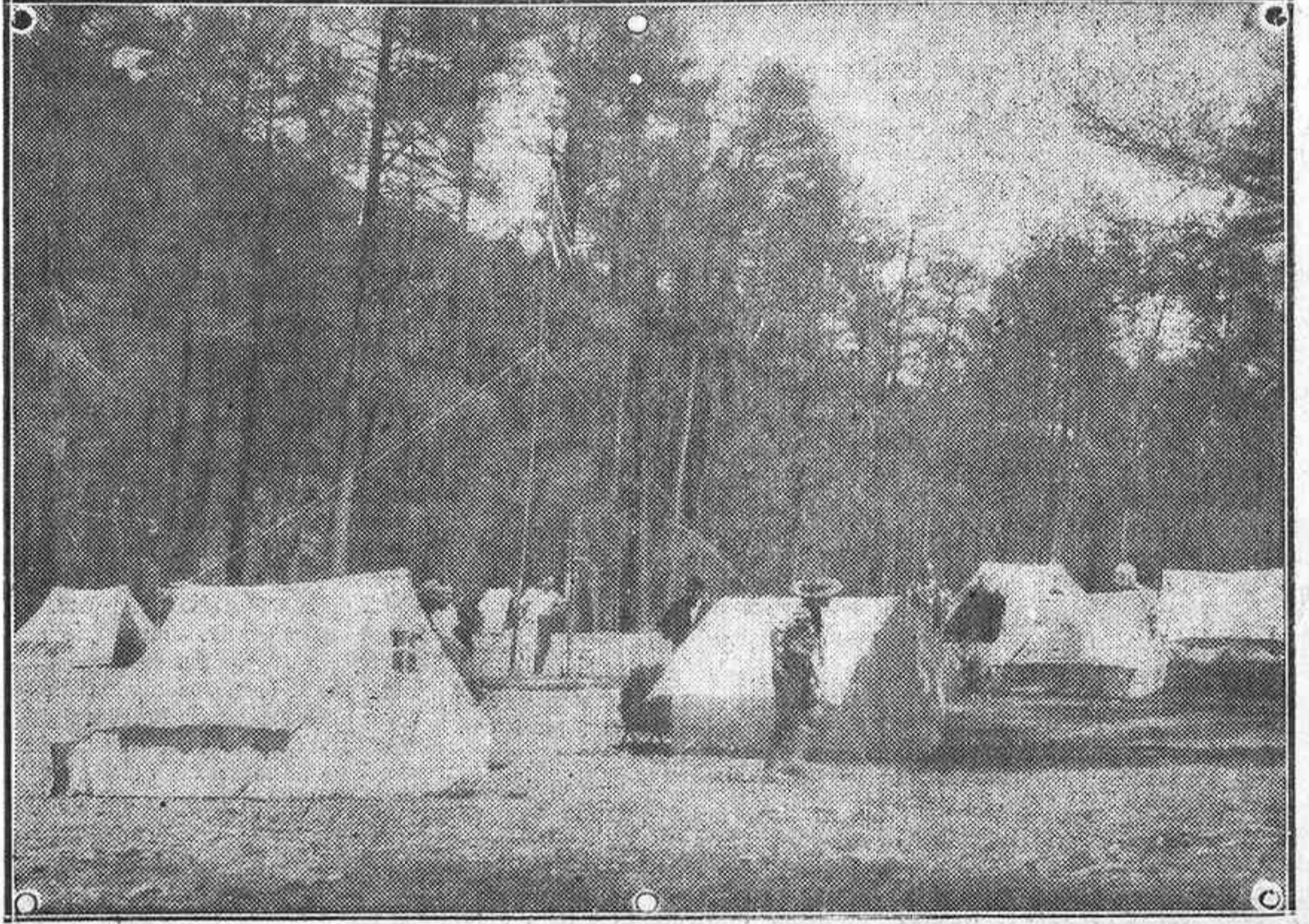
BAJO LOS AROMOSOS PINOS DE LA MONTAÑA, LOS "SCOUTS" VIGORIZAN SU CUERPO, FORTALECEN SU ESPÍRITU Y COMPLETAN SU EDUCACION Y CULTURA

jefe "scout" Superior de Holanda, y la dirigida al mismo por M. Hubert Martin, director del Bureau de Londres. Esas dos cartas, de 5