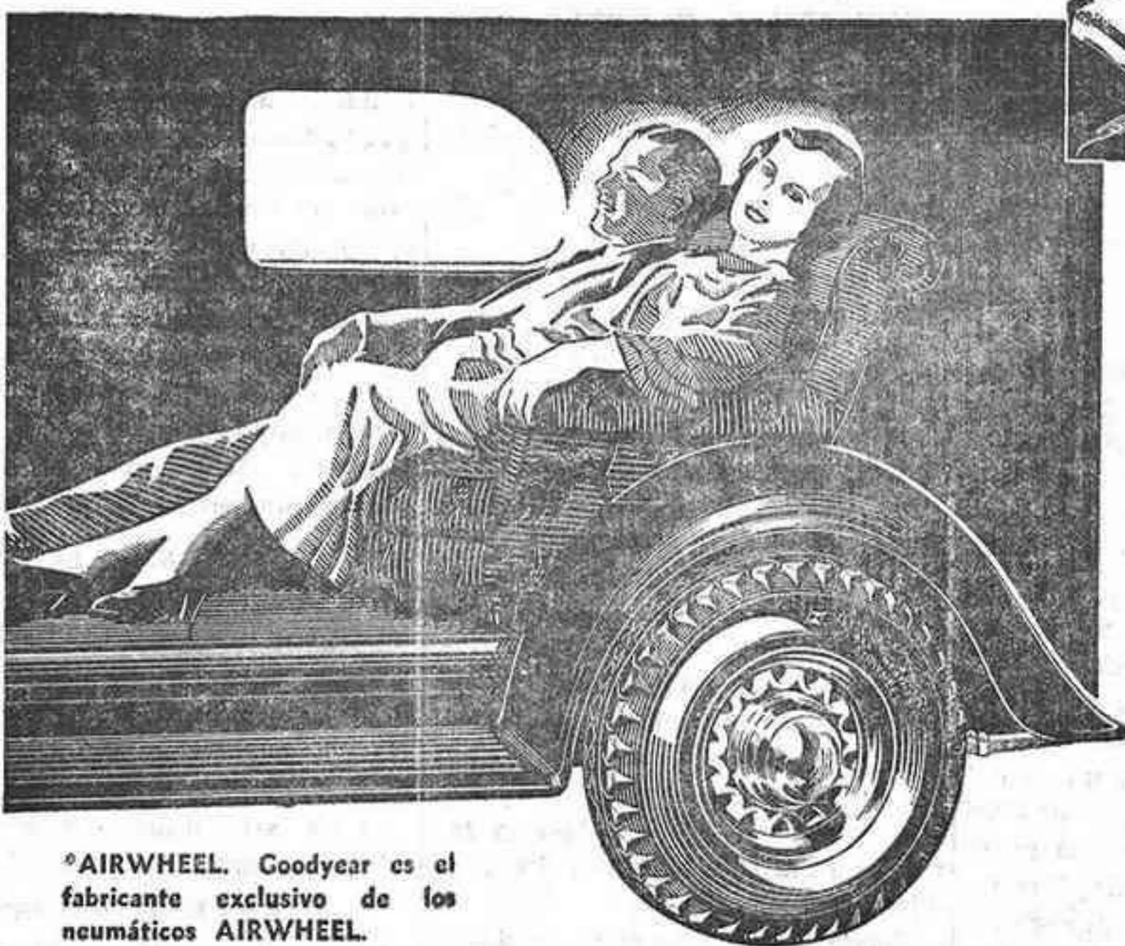
*AIRWHEEL. Goodyear es el fabricante exclusivo de los neumáticos AIRWHEEL.