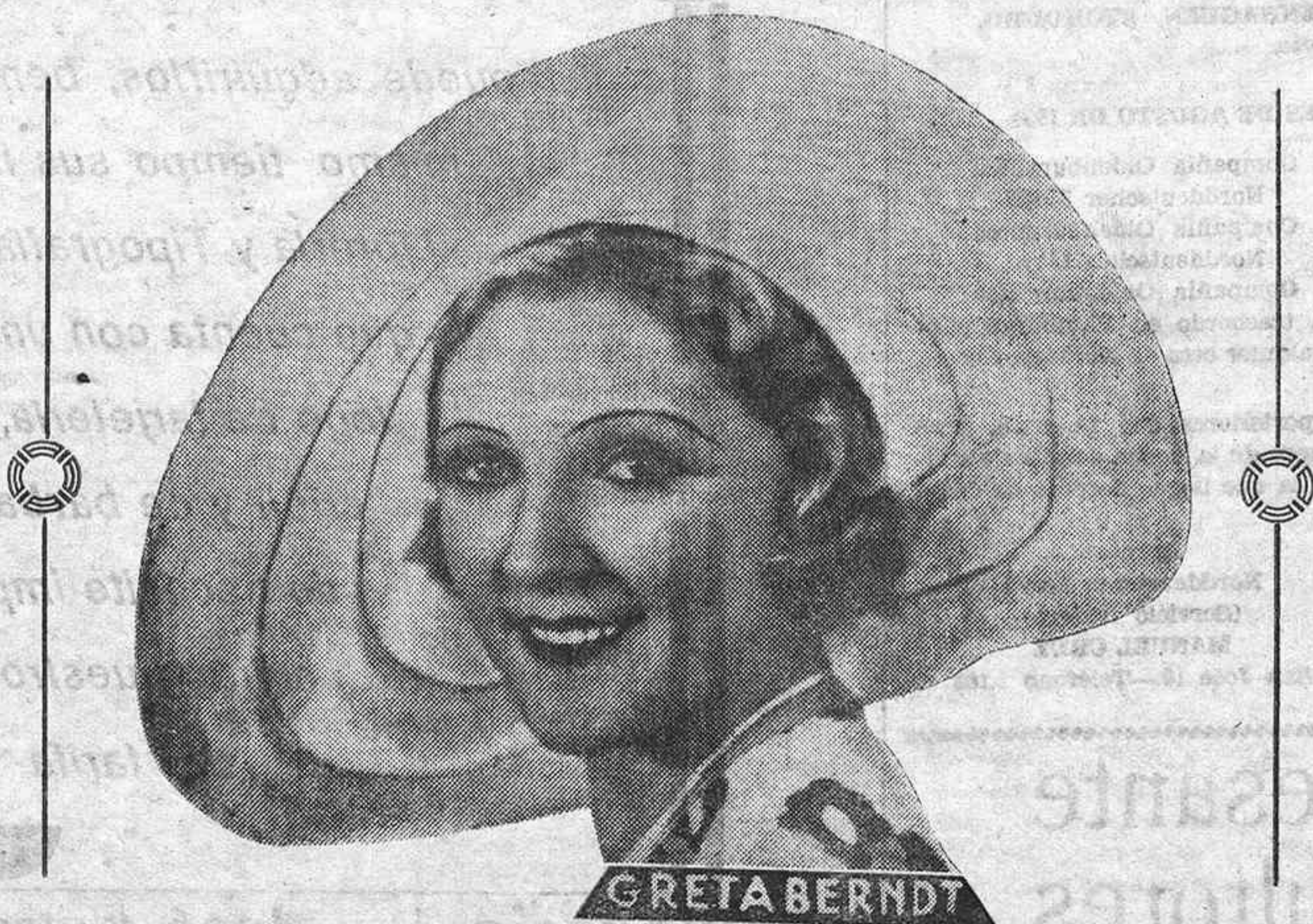
LA BELLA Y AFAMADA ARTISTA CINEMATOGRAFICA BERTA BERNDT