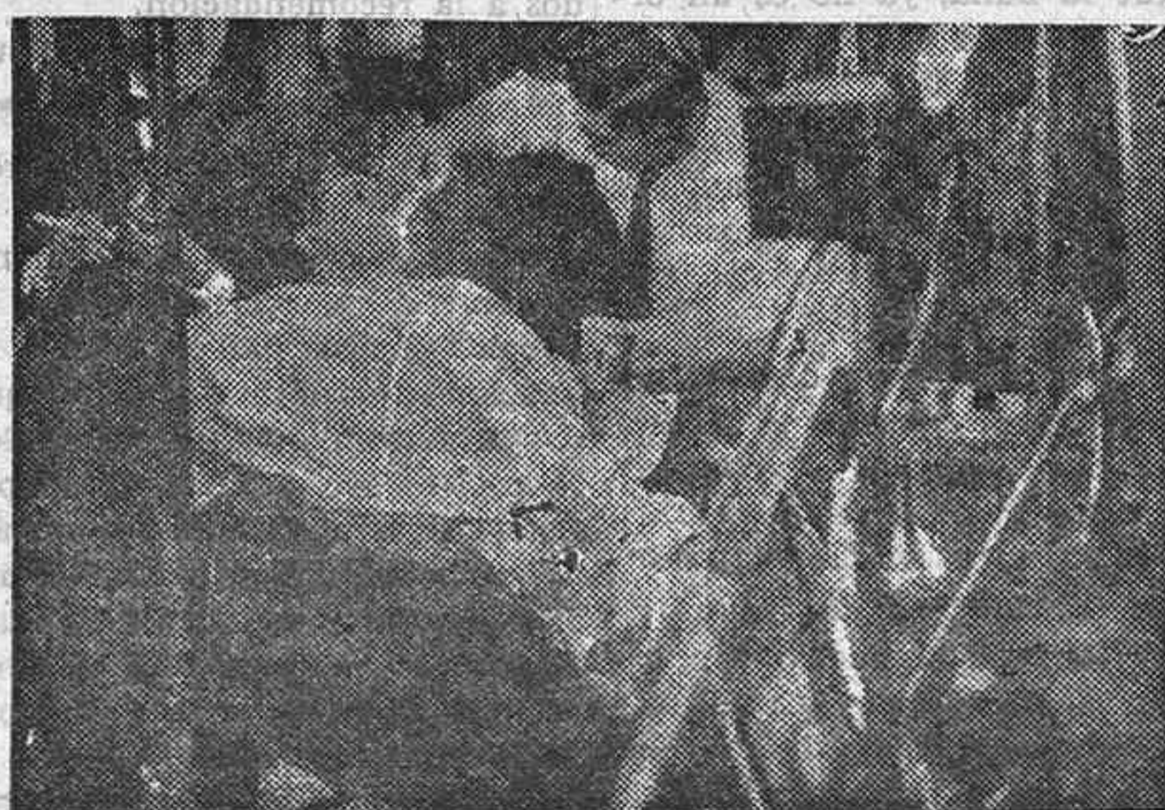
EL TIEMPO APREMIA EN LOS ESTUDIOS Y MAURICIO CHEVALIER ENTRE ESCENA Y ESCENA APROVECHA EL MOMENTO PARA PONER EN SU CARA LOS ARREGLOS DEL FIGARO