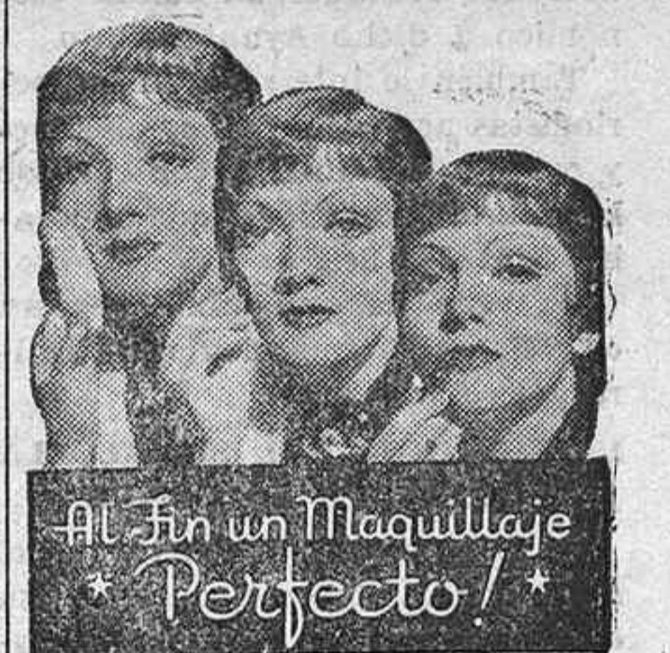
DEMOSTRACION POR CLAUDETTE COLBERT

Max Factor, El Genio del Maquillaje en Hollywood ha creado una nueva clase de cosméticos: polvos, coloretes y creyones para labios que armonizan a perfección con los delicados colores de cada persona.