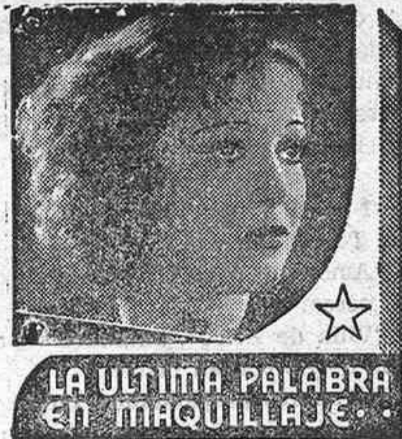
LORETTA YOUNG Estrella de 20th Century