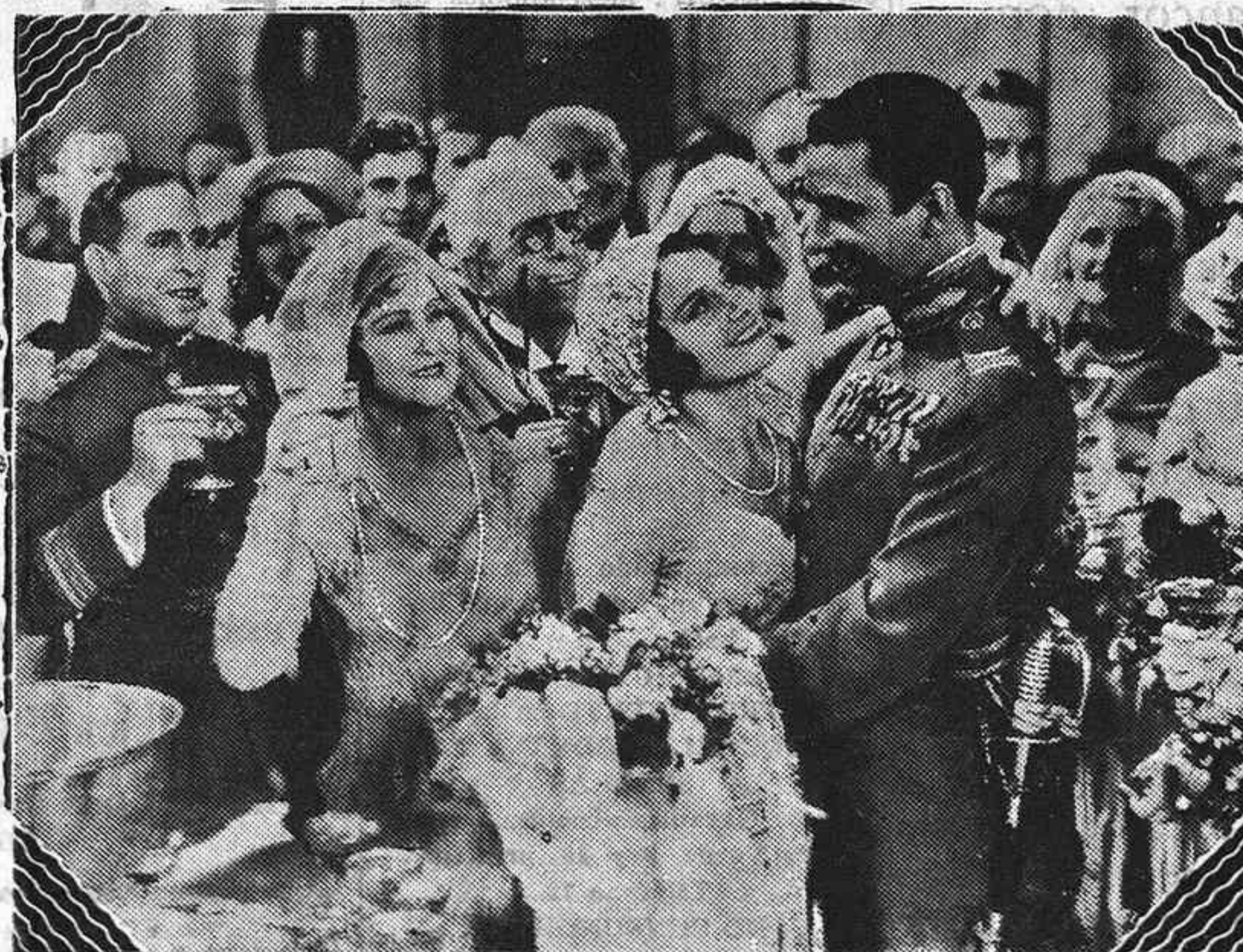
Vistosa escena de la magnífica película que en breve se estrenará en una importante sala de espectáculos cinematográficos de esta capital.