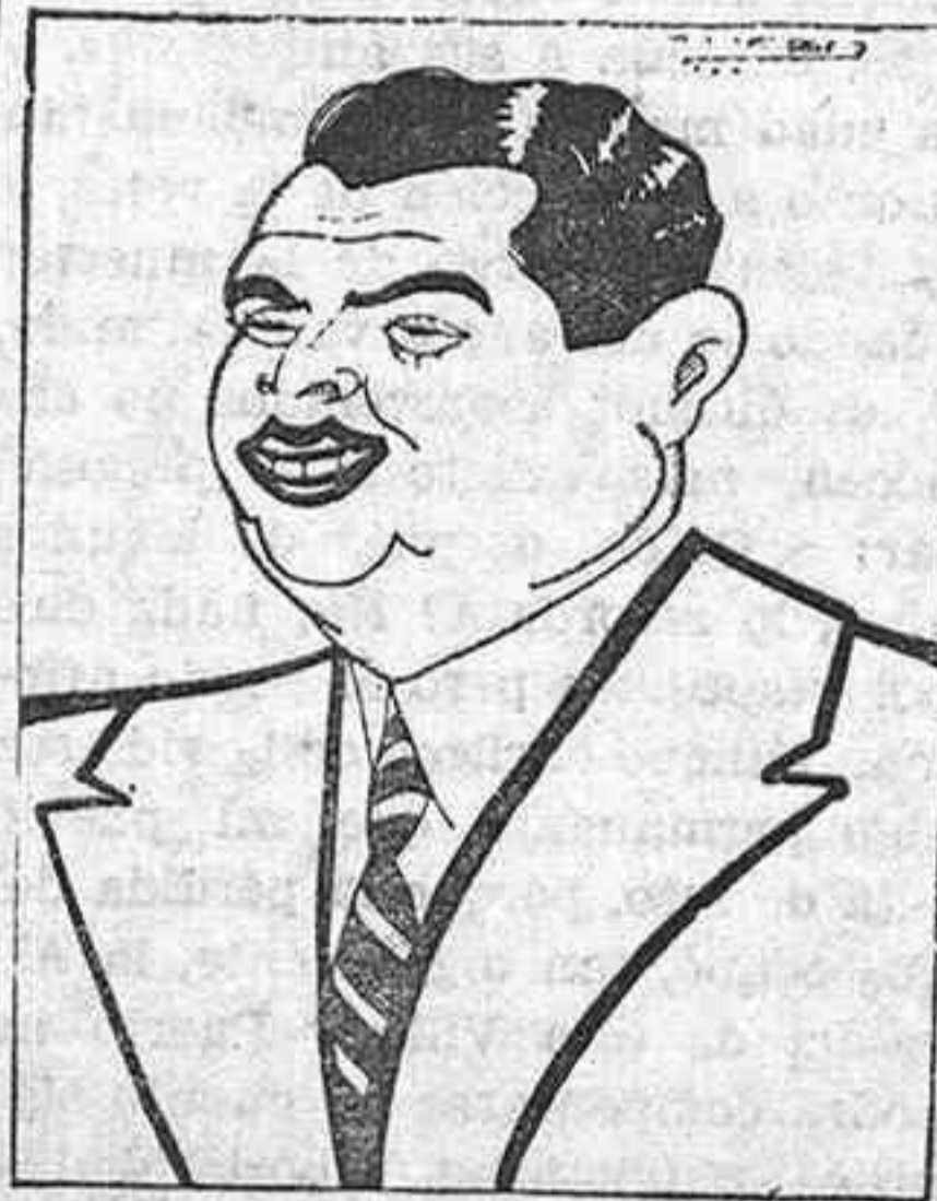
El ilustre ex ministro don José Calvo Sotelo, que ha llegado a Madrid, por haber sido incluido en la Amnistía.

Involuntariamente me abandoné a la contemplación de aquel gran espectáculo que ya habían visto de niño mis ojos como en una ilustración fantástica soñada por Gustavo Doré. El sol hundíase con rapidez en el ocaso y sus últimos