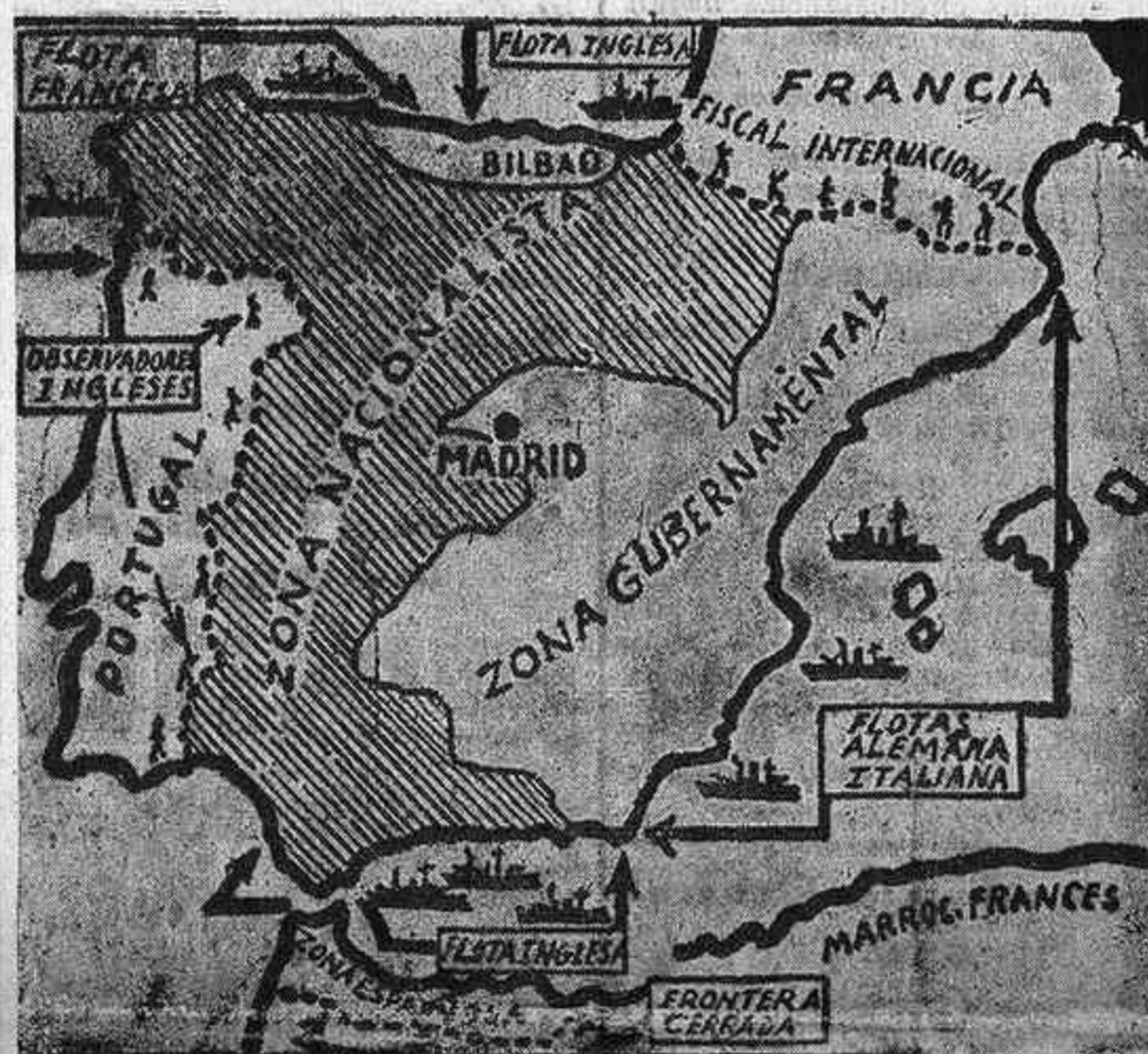
Este mapa editado por el Comité de no intervención adquiere de nuevo gran actualidad ante el anuncio de la retirada oficial de Italia y Alemania del plan de control, mientras no tengan las precisas garantías contra todo ataque de los bolcheviques

Londres, 1.—Mañana llegarán a Gibraltar cuatro enfermeras alemanas que serán transportadas en avión, con objeto de atender a los marinos heridos del "Deutschland", hospitalizados en aquella plaza.