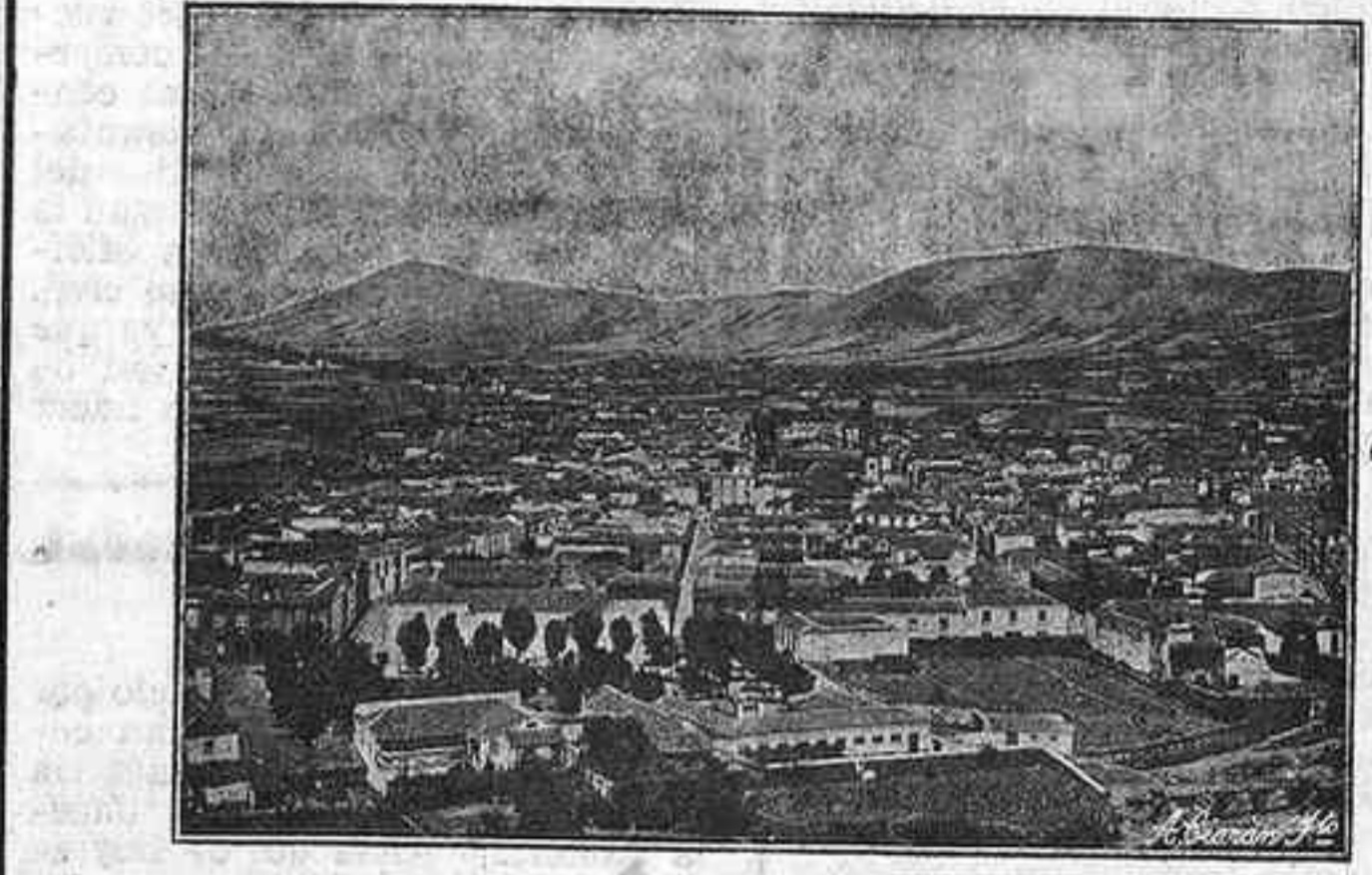
Una vista parcial de la ciudad de La Laguna que hoy, festividad del Corpus Christis, celebrará con gran esplendor dicha solemnidad religiosa, adornando sus calles con magníficos tapices de flores, que son el orgullo de propios y extraños

París, 26.—Llegan noticias de que los grupos de la F. A. I. que hace unos días lograron apoderarse por la violencia de Barbastro, asediando a varios elementos republicanos moderados, han llegado a extender el movimiento anarquista hasta Pulgarcá, Cervera y Balaguer, donde se han hecho fuertes, montando nidos de ametralladoras en lugares estratégicos.