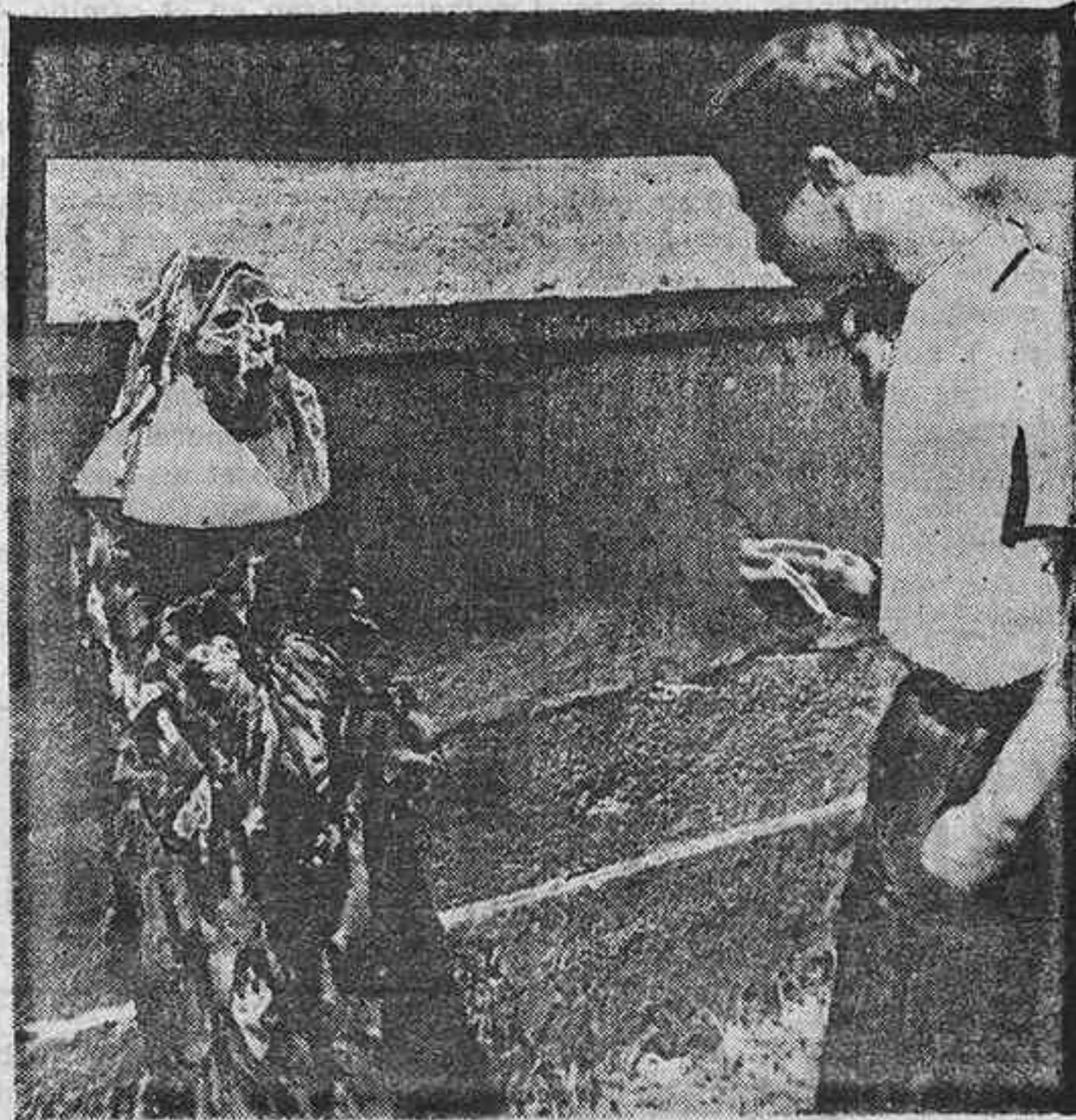
En el curso de las luchas que han ensangrentado a Barcelona, los conventos han sido saqueados, las sepulturas profanadas y, odioso refinamiento de un cinismo alucinante: los cuerpos de las carnitas exhumados y expuestos ante una iglesia. El macabro espectáculo no parece conmover a este joven transeúnte.

Radio Las Palmas (A las 2 de la tarde del sábado, 8) MALAGA ESTA PRONTO A RENDIRSE