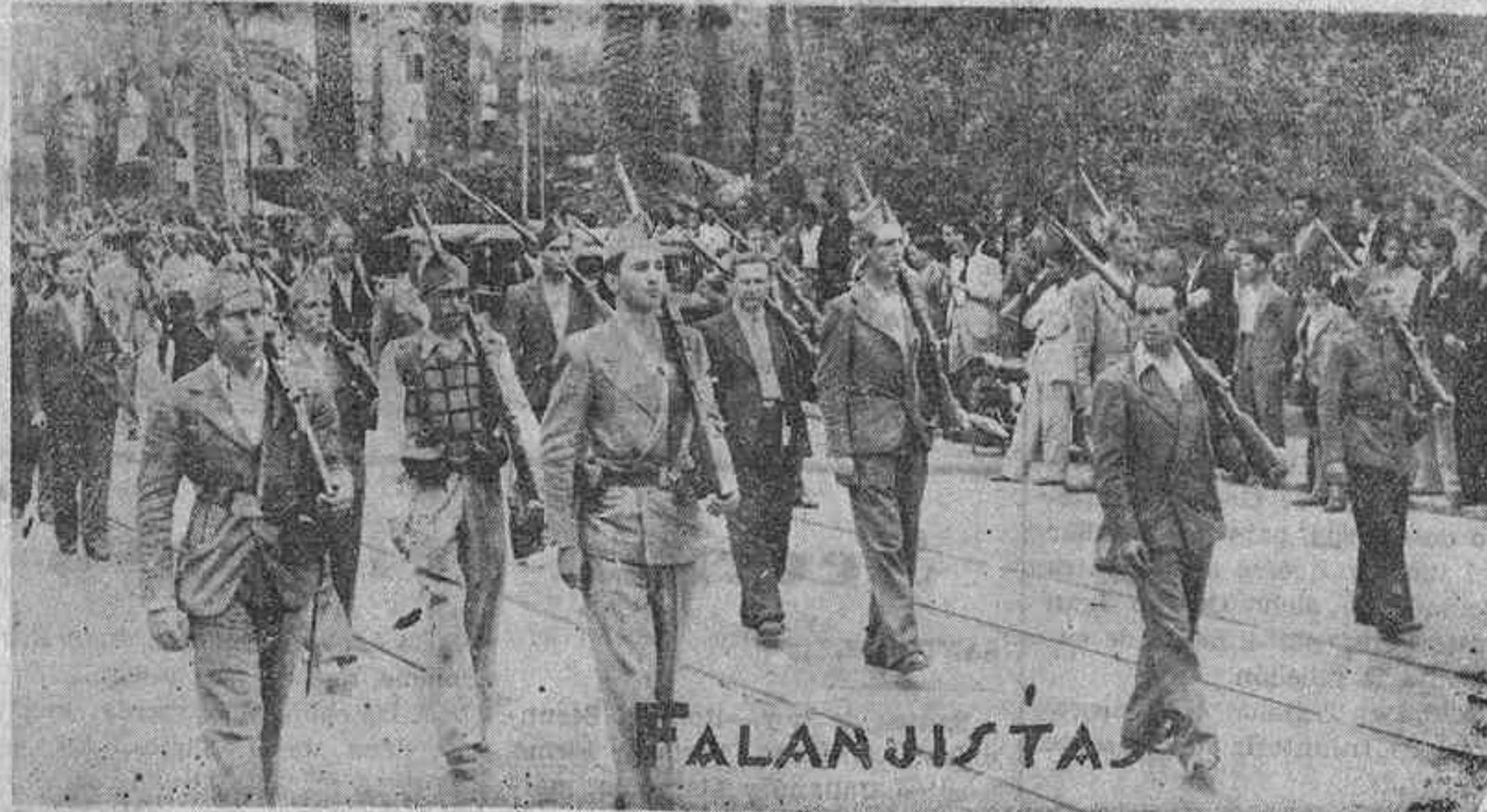
UNA MARCHA DE LOS FALANJISTAS DE LAS PALMAS, COLABORANDO CON LOS BENEMERITOS CUERPOS DEL EJERCITO Y GUARDIA CIVIL PARA LIBERTAR A ESPAÑA DE LA PESADILLA MARXISTA Y DE LA INFLUENCIA MOSCOVITA