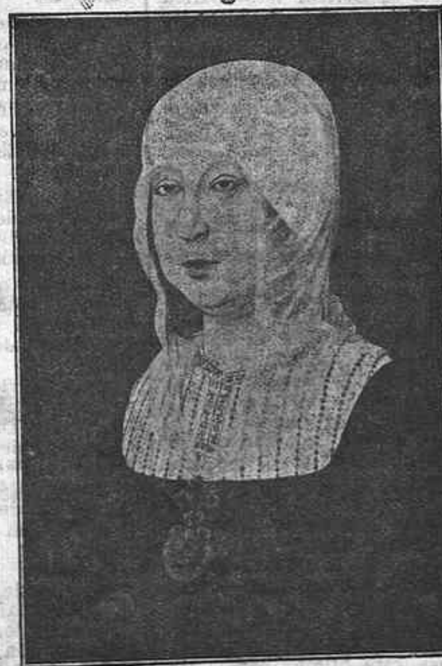
3 de agosto de 1492, fecha española y universal. Cristóbal Colón, protegido por la Reina Isabel, en el nombre de la Santísima Trinidad, zarpa del puerto de Palos, con el fin de descubrir el Nuevo Mundo

(Léase en la página 3 el interesantísimo artículo que hemos reproducido de "Gaceta Regional", de Salamanca)