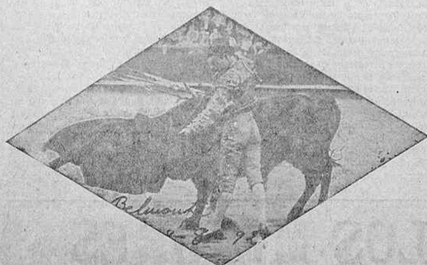
El aplaudido diestro José Belmonte, que tomará parte en las corridas de toros que se celebrarán en esta capital los días 4 y 3 del próximo mes de Mayo.