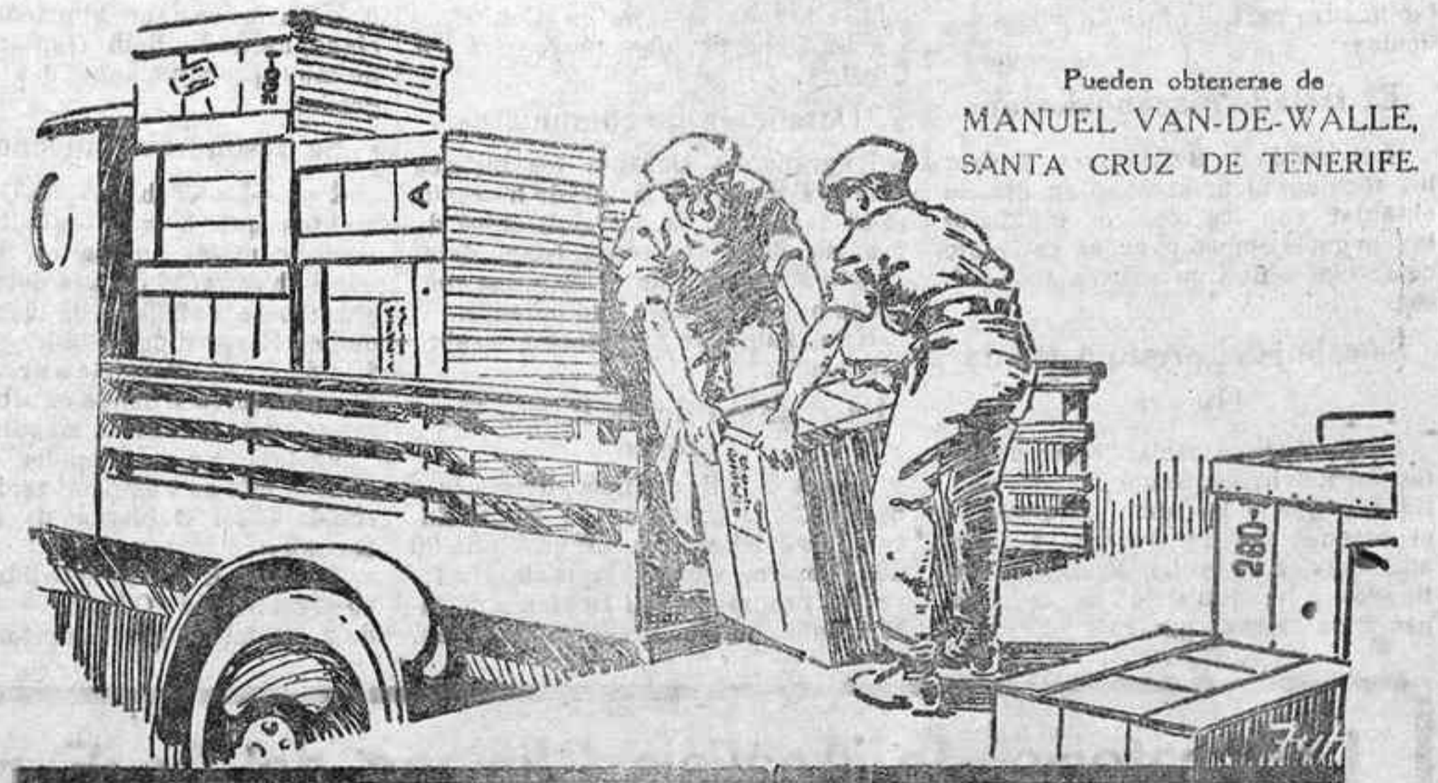
Pueden obtenerse de MANUEL VAN-DE-WALLE , SANTA CRUZ DE TENERIFE.

LOS BANDAJES DUNLOP Macizos normales. Macizos super-elásticos. Macizos "Giant Single."