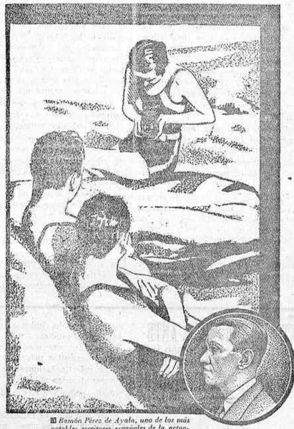
Ramón Pérez de Ayala, uno de los más notables escritores españoles de la actualidad, miembro igualmente del Jurado

Con una sola fotografía puede usted alcanzar varios premios: el del grupo correspondiente al asunto tratado, pesetas 1.000; el Gran Premio Nacional, pesetas 5.000; el Premio Internacional de grupo, pesetas 8.000, y por último,