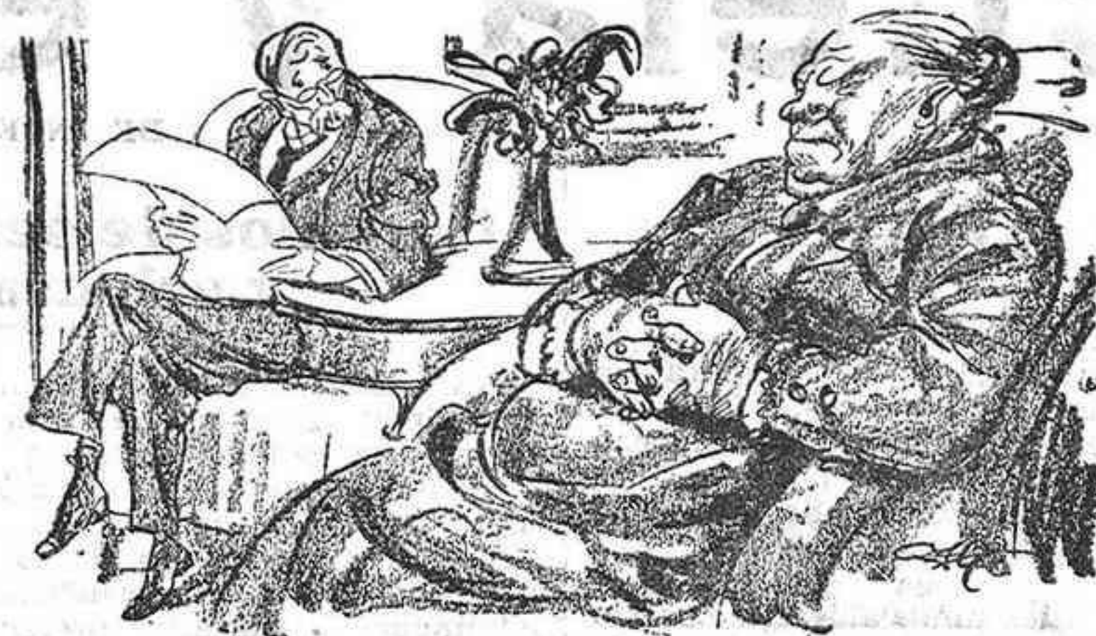
LA "ARMONIA" CONYUGAL

(antiguo encargado del café "La Peña") Ofrece al público un excelente servicio.