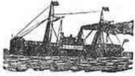
El magnífico vapor

que saldrán de Santa Cruz de Tenerife para los puertos que á continuación se expresan: