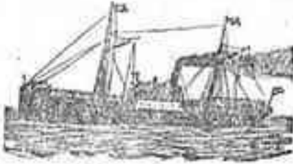
El magnífico vapor

LISTA DE LOS VAPORES que saldrán de Santa Cruz de Tenerife para los puertos que á continuación se expresan: