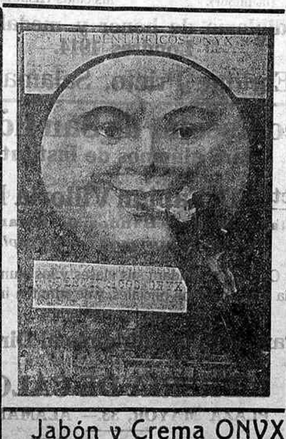
Jabón y Crema ONYX

¿Hay algo más desagradable y nocivo que una boca descuidada?