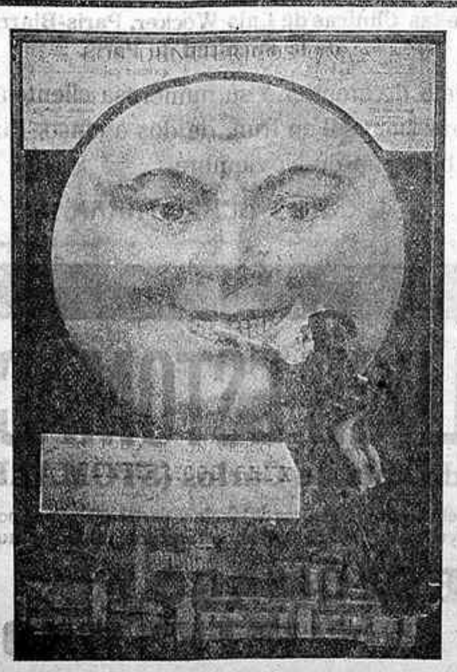
Jabón y Crema ONYX

¿Hay algo más desagradable y nocivo que una boca descuidada?