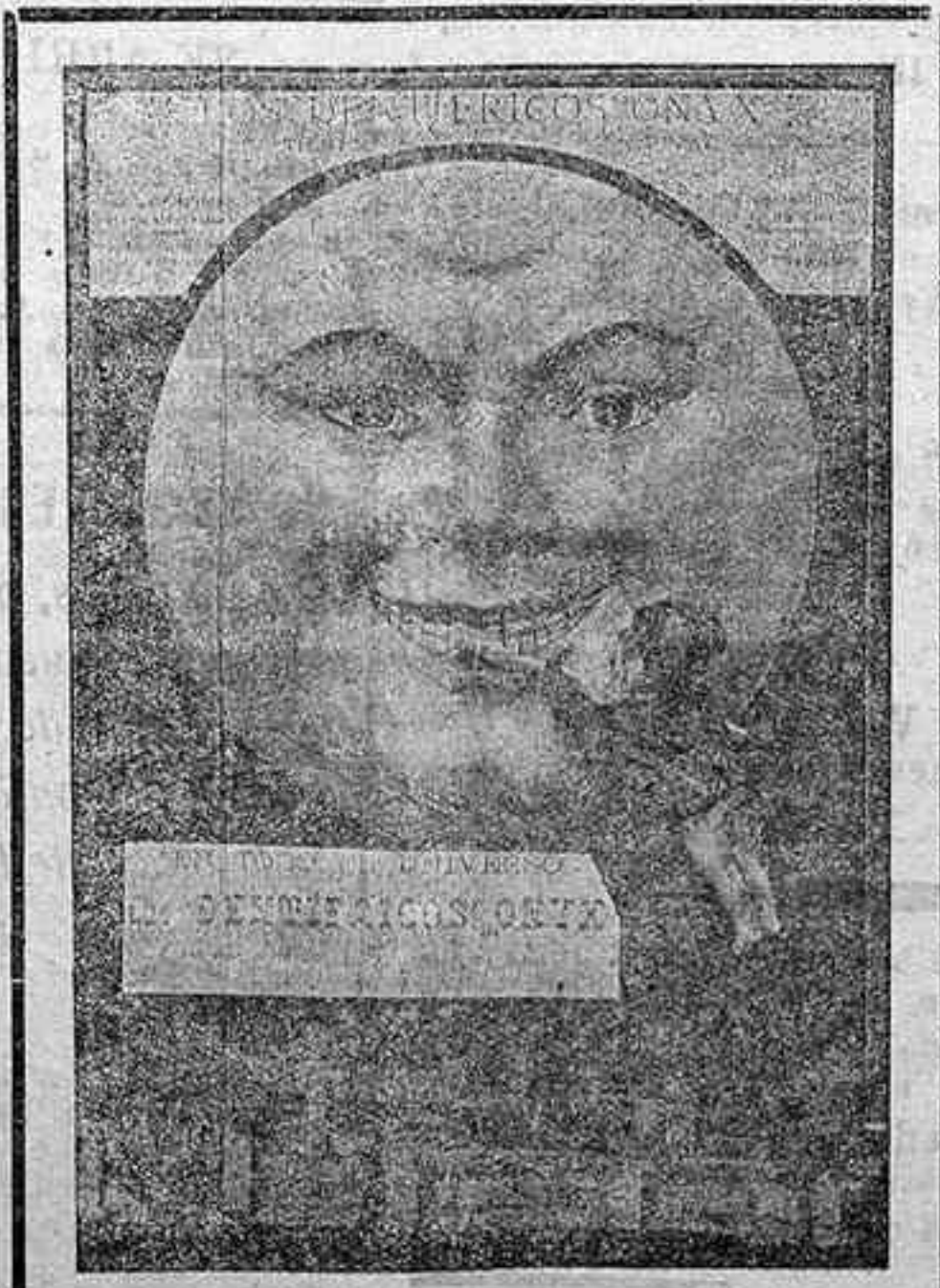
Jabón y Crema ONYX

¿Hay algo más desagradable y nocivo que una boca descuidada?