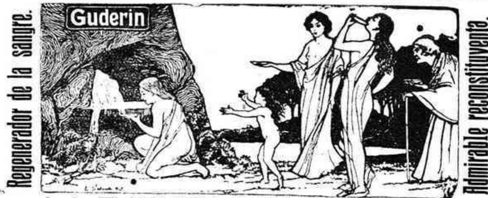
Regenerador de la sangre.

NOTA.—Fijarse en el rótulo anunciador colocado sobre la puerta del despacho, que estará abierto todos los días hasta las doce.