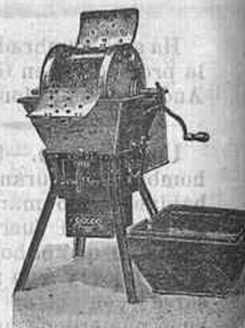
Máquina de lavar Todo Vapor

Útil á todos: desde la familia más reducida hasta los más grandes establecimientos.