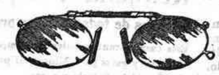
Lentes o Gafas de CRISTAL ROCA, 5 Pesetas.