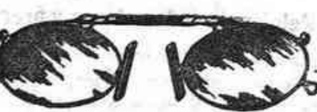
Lentes o Gafas de CRISTAL ROCA, 5 Pesetas.