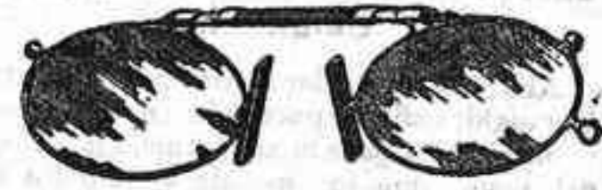
Lentes o Gafas de CRISTAL ROCA, 5 Pesetas.

GRAN RELOJERIA Y OPTICA DE Antonio Ferreira P. Mayor, 40 (acera de Correos) SALAMANCA