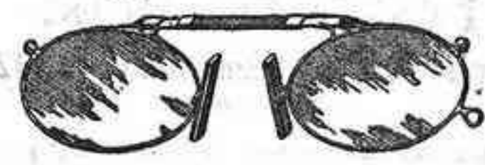
Lentes o Gafas de CRISTAL ROCA, 5 Pesetas.